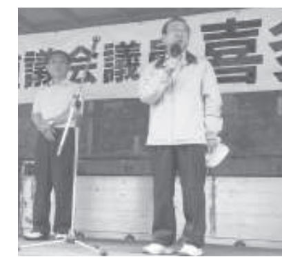
札内後援会野遊会