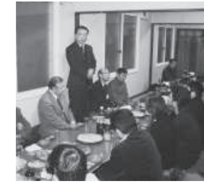
鹿追後援会新年交礼会