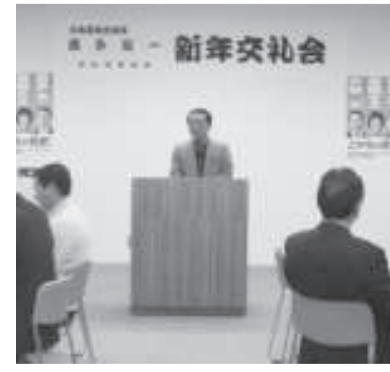
中札内後援会新年交礼会