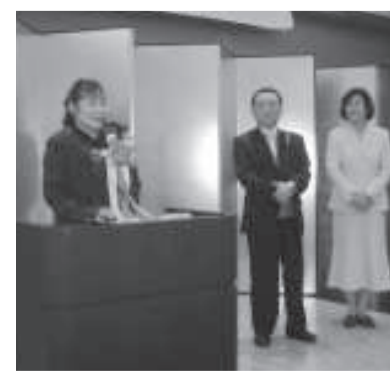
喜多龍一女性の集い