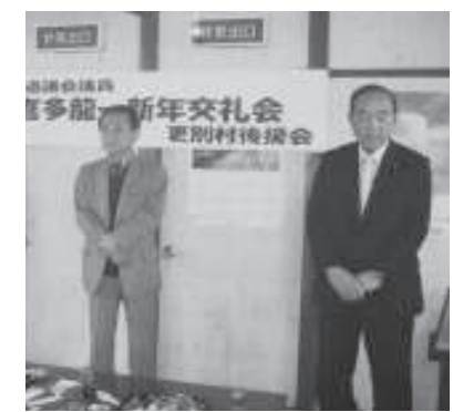
更別後援会新年交礼会