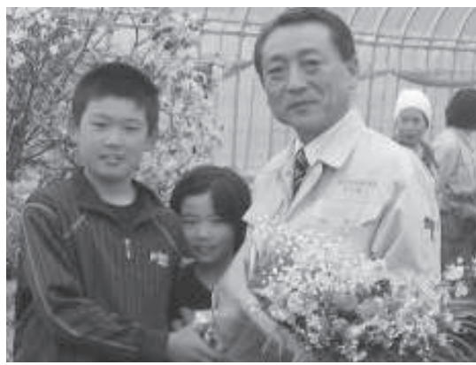
議長就任祝い(中足寄)