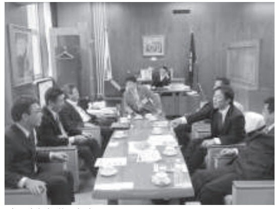
音更青年部議長室訪問