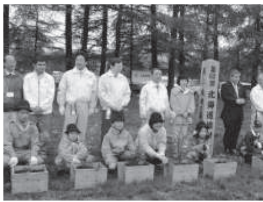
北海道植樹祭 in おびひろ