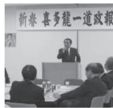
陸別後援会新年交礼会