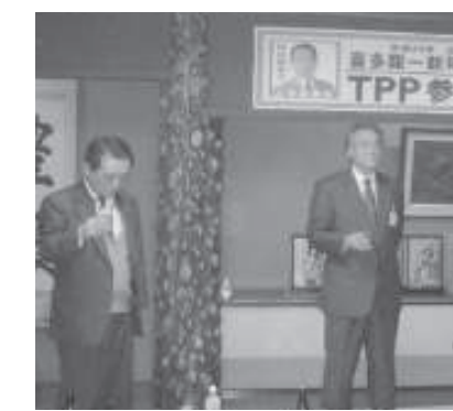
足寄後援会新年交礼会