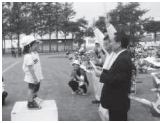
北海道立帯広聾学校 運動会