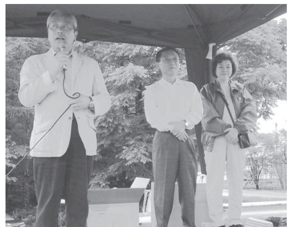
音更後援会野遊会