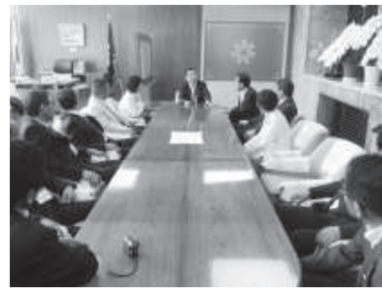
幕別町議会が議長室訪問