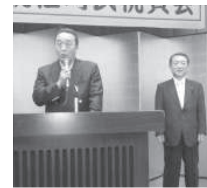
広尾町議長就任町民祝賀会