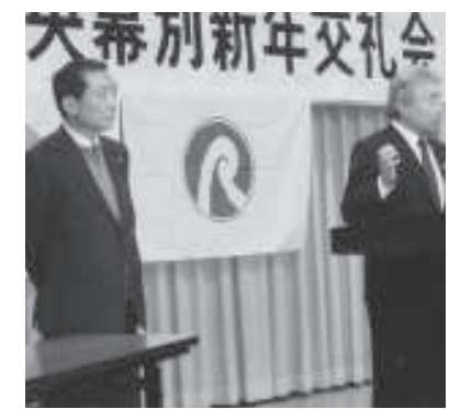
中央幕別後援会新年交礼会