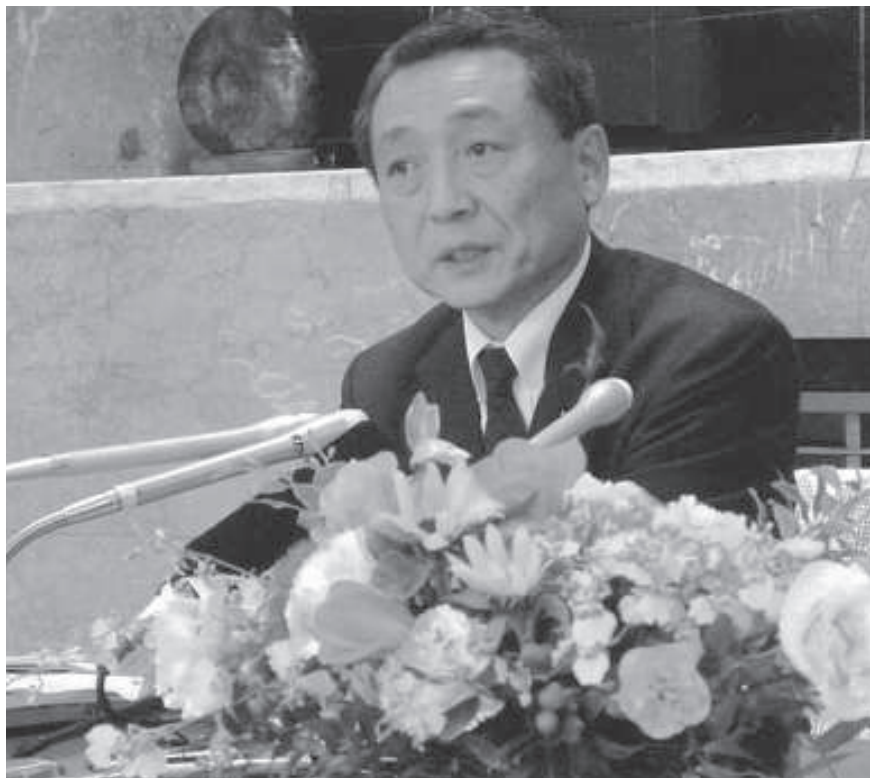
議長就任記者会見(平成23年5月17日)

私は広尾町音調津に生まれ、炎天下の昆布干し、凍てつく寒さの魚の網はずし、畑仕事、冬山の薪伐りなどの手伝いをして育ちました。雪や雨や高波で頻繁に通行止めになり、手遅れで子供が亡くなる地域での厳しい生活体験から、進学で上京後「故郷のために何かできないか」との思いが強まりました。そして、「日々の暮らしや産業経済の営みの中に、政治の課題があるんだ」という認識のもと、できる限り「歩くこと」を続けてきました。