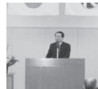
芽室後援会新年交礼会