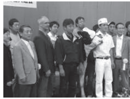
十勝総合家畜共進会