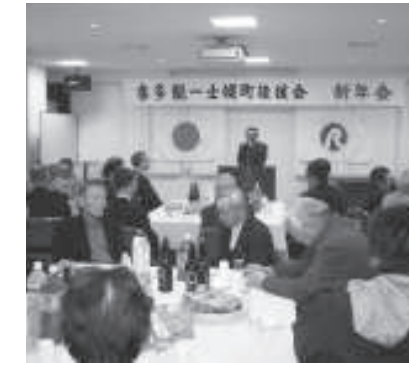
士幌後援会新年交礼会