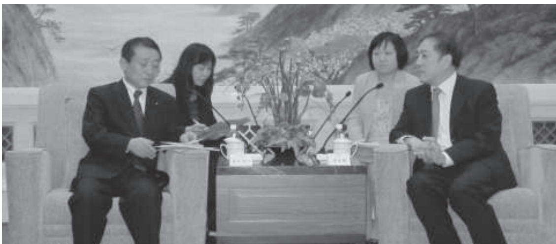
北海道議会代表団中訪問